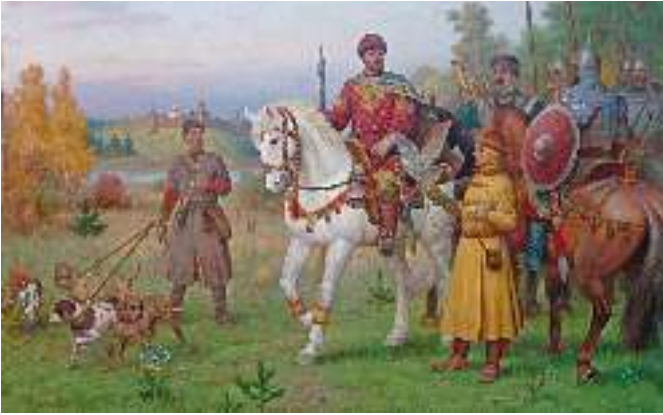
В. Тормосов. Володимир Мономах на полюванні

« Повчання дітям » Володимир Мономах (1053–1125) написав наприкінці свого життя. У ньому він закликав своїх синів до праці й науки, до того, щоб вони захищали інтереси держави. У добу міжкнязівських чвар князь навчав їх тримати слово, « не давати сильним губити людину » і зауважував, що сам не давав кривдити ані бідного смерда, ані вбогу вдову.