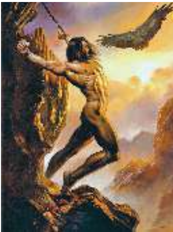
Б. Вальєхо. Прометей