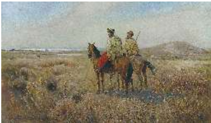
С. Васильківський. Козаки в степу

й передає матері трагічну звістку про смерть її сина. Зворушливо звучить діалог з матір'ю, про смерть сина він говорить фігурально: «... Та вже ж твій син оженився, / Узяв собі паняночку, / В чистім полі земляночку ».