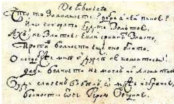
Автограф вірша Г. Сковороди «De libertate»

свобода, заперечує порівняння цього людського блага із золотом: «зрівнявши все злото, / Проти свободи воно лиш болото». В останніх двох рядках він згадує й прославляє Б. Хмельницького як символ вольності — у другій половині XVIII ст. ще живими були в народній пам'яті бої за визволення з-під національного й соціального гноблення. Письменник, мабуть, написав цей вірш на одному диханні — гарним, розмашистим почерком, без виправлень, у цьому можна переконатися, розглянувши автограф «De libertate».