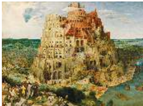
П. Брейгель Старший. Вавилонська вежа