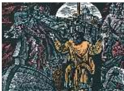
В. Лоната. Ілюстрації до «Слова про похід Ігорів»