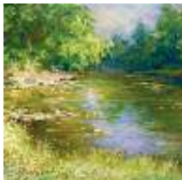
Г. Немировський. Ясний день