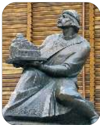
Пам'ятник Ярославу Мудрому. м. Київ