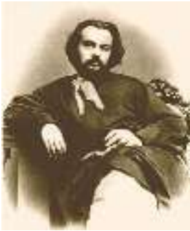
М. Старицький. Фото

М. Старицький належить до покоління письменників, які перебували під могутнім впливом Шевченкової творчості. Чи не всі тогочасні поети наслідували художню манеру автора «Кобзаря». І. Франко зазначав, що М. Старицький був першим, хто почав змінювати псевдошевченківські шаблони в поезії, що це вже робили П. Куліш, а потім Б. Грінченко, В. Самійленко, Леся Українка, А. Кримський і «ціла фаланга молодих».