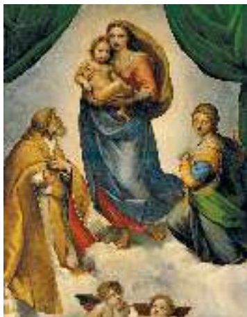
Рафаель. Сикстинська Мадонна