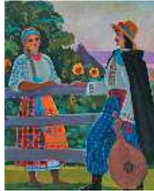
І. Гончар. Під вечір