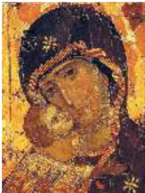
Володимирська ікона Божої Матері. Храм Святого Миколая. с. Товмач, Львівська область

Кожен із майстрів слова послуговується різними мовними ресурсами для творення образів (зокрема, зорових): тропами, синтаксичними фігурами, віршованою чи прозовою формою тощо — унаслідок цього виникають різні образи, які по-своєму красиві й естетично вартісні. Отже, ідейність, образність та емоційність здатні захоплювати читача, впливати на його виховання.