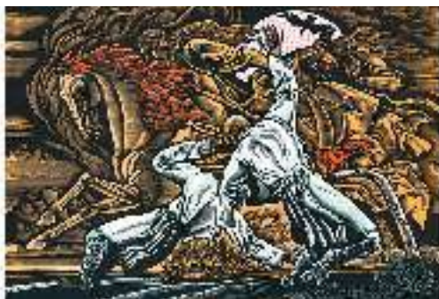
В. Лопата. Ілюстрація до «Слова про похід Ігорів»

Князь Всеволод , брат Ігоря, нагадує билинного богатиря, його у творі названо « буй-туром ». Він, сміливий і відчайдушний, не думає про почесні, багатство й золотий батьківський престол у Чернігові, про ласку своєї дружини. Цей герой, як і Ігор, уособлює відвагу й силу.