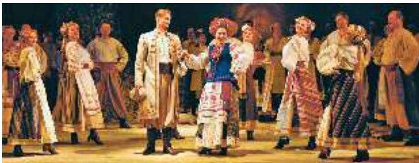
Сцена з вистави «Наталка Полтавка». Львівський національний академічний театр опери та балету ім. С. Крушельницької

Яскравим засобом характеротворення возного Тетерваковського є його мова, а точніше — жажливий суржик з українських і російських слів, словесний паразит «теє-то як його» . Його невігластво видає й розмова з Петром про театр. Хай там як, але в цій заскорузлій душі є місце й великодушності. Згадайте фінальний епізод п'єси, у якому він відступає від Наталки й просить Терпилиху благословити дітей на щастя й любов. Отже, образ возного неоднозначний: він і здирник, бюрократ і водночас — людина, спроможна на щирі почуття й добрі вчинки.