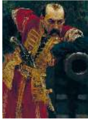
І. Рєпін. Кошовий отаман

Художньо відтворюючи час кривавого розбрату (доба Руїни), П. Куліш згадує недавнє, а подеколи й давнє минуле України та її