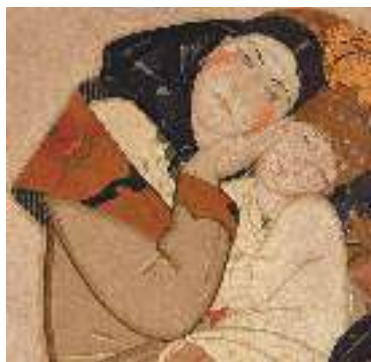
Ф. Кричевський. Триптих «Життя». Фрагмент

Художні образи та втілені в них ідеї не повторюють чи копіюють нашу дійсність у літературному творі; пишучи повість чи поему, майстер слова створює нову естетичну дійсність , що вбирає в себе свій час і є носієм загальнолюдських цінностей. Змальована письменником дійсність реалізується лише в особі читача, без якого вона мертва. Як же виявляється мистецька самобутність письменника у створеному ним художньому світі?