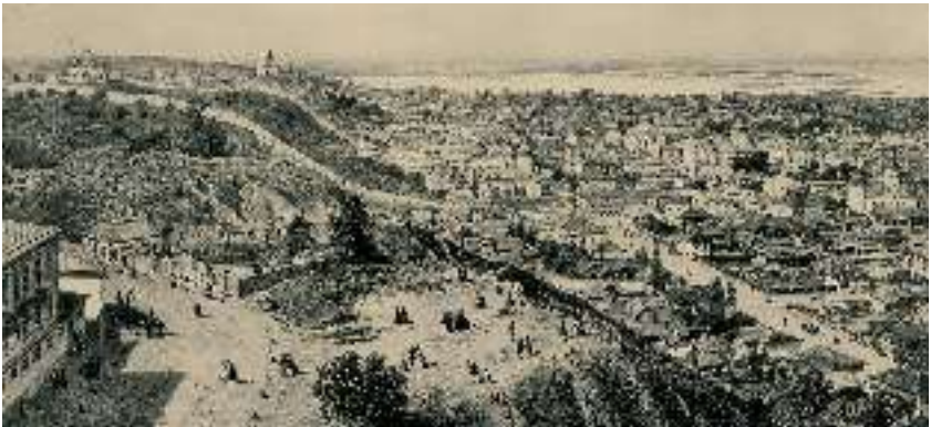
Вид на Поділ. Гравюра. 1862 р.

Тоді ще трохи не весь Київ містився на Подолі; Печерського не було зовсім, а Старий, або Верхній, город після Хмельниччини безплодовав. Де-не-де стояли по Подолу кам'яниці; а то все було дерев'яне: і стіни з баштами круг Подолу, і замок на горі Киселівці. Улиці були узенькі,