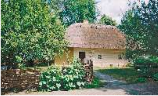
Батьківська хата Т. Шевченка (реконструкція). с. Моринці, Черкаська область. Сучасне фото