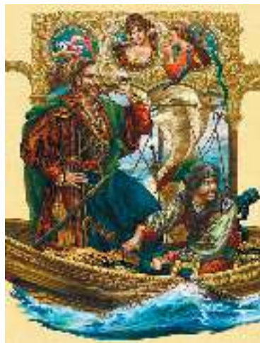
О. Тернавська. Ілюстрація до поеми І. Котляревського «Енеїда»

Образи богів , жителів Олімпу (Зевс, Венера, Юнона, Нептун, Еол, Меркурій), земні герої (цар Латин, Ацест, Турн, Дідона) —