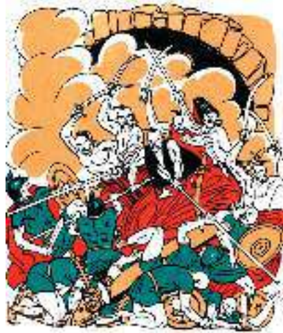
А. Базилевич. Ілюстрація до поеми І. Котляревського «Енеїда»

Латинці до лісу слідили Одважних наших розбишак І часовими окружили, Що з лісу не шмигнеш ніяк; А часть, розсипавшись по лісу, Піймали одного зарізу, То Евріала-молодця. Тогді Низ на вербу збирався, Як Евріал врагам попався, Мов між вовків плоха вівця.