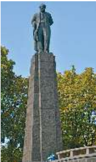
Пам'ятник Т. Шевченку на Чернечій (Тарасовій) горі. м. Канів

1860 р. вийшло друком нове видання «Кобзаря». Рада Академії мистецтв присвоїла Т. Шевченкові звання академіка гравірування.