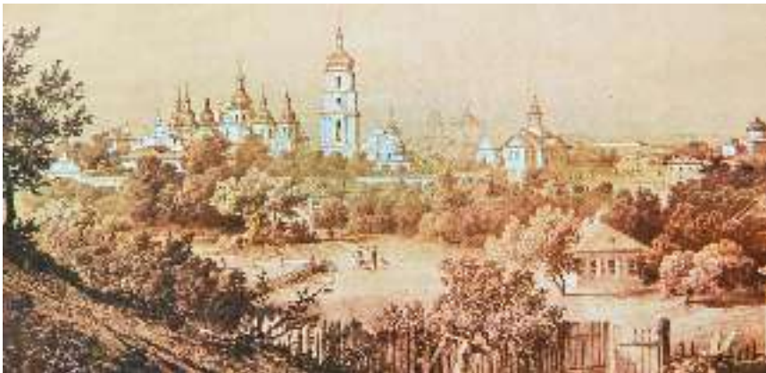
В. Тімм. Краєвид старого міста з Ярославового Валу. Літографія. 1854 р.

Отже, і Шрам, розглядаючи ту горорізьбу да читаючи епітафії, засмутився душею да й каже: