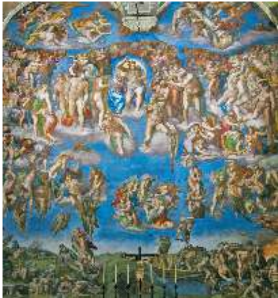
Мікеланджело. Страшний суд

На всіх етапах розвитку літератури й образотворчого мистецтва майстри слова й пензля постійно зверталися до сюжетів і мотивів Святого Письма, використовували його образи в літературі й образотворчому мистецтві. До таких творів належать поема «Мойсей» І. Франка, «Давидові псалми» Т. Шевченка, драма «Одержима» Лесі Українки, роман «Майстер і Маргарита» М. Булгакова,