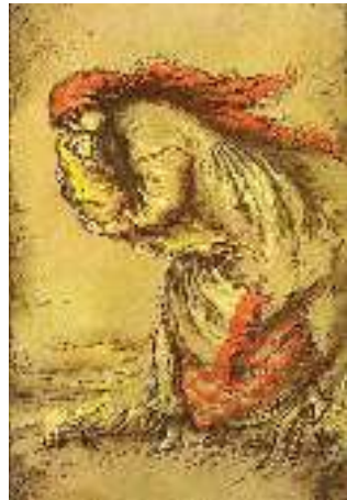
К. Штанко. Ілюстрація до поеми Т. Шевченка «Наймичка»