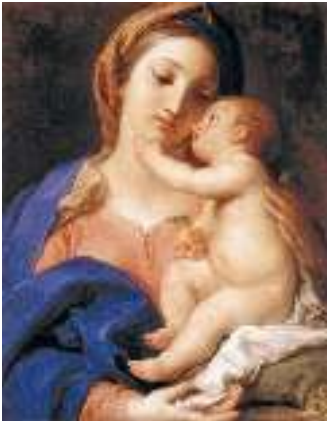
П. Батоні. Мадонна з Немовлям

Основне джерело поеми — євангельська легенда про Марію, Йосифа й Ісуса. Т. Шевченко уникає зображення суто містичних сюжетів, замінюючи їх реалістичними подіями. На думку поета, саме мати — головна вихователька й учителька добра й любові до людей; це її життєве покликання. Так зображено Марію — ідеальну, але стражденну матір, через те, що вона покритка, яку Йосип, по-батьківськи люблячи, урятував від побиття камінням, одружившись із нею. Тут варто процитувати слова І. Франка про ідеал жінки-матері: «Не знаю в літературі всесвітній поета, котрий би представив такий високий і такий щиро людський ідеал жінки-матері, як се вчинив Шевченко... Не посвячення своєї людської індивідуальності для мужчини, але найвище натуження тої індивідуальності для діл милосердя, переможення власних терпінь, забуття власних ураз, де йде о службі високій і піднеслій ідеї — добра загалу, добра людськості, — то ідеал жінки, який полишив нам у спадщину Шевченко.