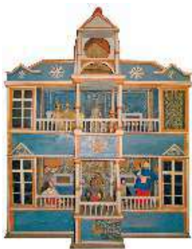
Вертеп. XVII–XVIII ст.

життя, як правило, комічного характеру («народна» частина драми). У верхній частині діяли святі й сатана, тут відбувалися сцени поклоніння пастухів і волхвів. Ця частина драми закінчувалася смертю Ірода, після якої люд мав би веселитися, тому з цього моменту дію переносили на нижній ярус. Тут улюбленцями глядачів були Запорожець (Солдат), Шинкарка, Дяк, Дід і Баба. Якщо перша частина має книжне походження (вона написана книжною мовою, у якій багато церковнослов'янізмів), то друга — є витвором народу, у ній спостерігаємо віддзеркалення тогочасного українського побуту.