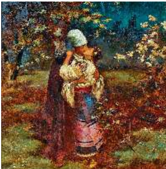
М. Івасюк. Поцілунок

(...) Аж ось двері — рип! — і Василь у хату. Маруся так і нестямилась і крикнула не своїм голосом: «Ох, мій Василечку!» — та й