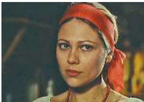
Кадр із кінофільму «Чорна рада»

(...) Обернувся козак, переступаючи через поріг, — і серце в його заграло: Леся не спускала з його очей, а в тих очах сіяла й ласка, і жаль, і щось іще таке, що не вимовиш ніякими словами. Сподобався, видимо, козак дівчині. (...)