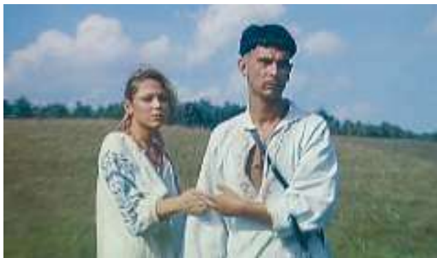
Кадр із кінофільму «Чорна рада»