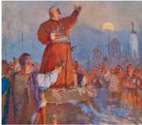
М. Дерезус. Ілюстрація до повісті М. Гоголя «Тарас Бульба». (Фрагмент)

гомону в місті бачив усе те й моторно робив, що треба: будував, давав накази, поставив у три табори курені й сточив їх возами, зробивши з них немов рухомі фортеці, у яких козаки були нездоланні; двом куреням звелів стати в засідку, повтикав частину поля гострими кілками, поламаними списами й поламанною зброєю, щоб при нагоді нагнати туди ворожу кінноту. І коли вже все було зроблене як слід, промовив слово до козаків, — не на те, щоб їх підбадьорити, бо знав він, що й без того міцний дух мають козаки, а просто самому кортіло висловити все те, що було в нього на серці.