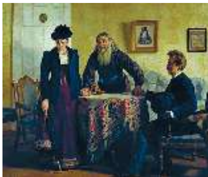
М. Неврев. Умовляння