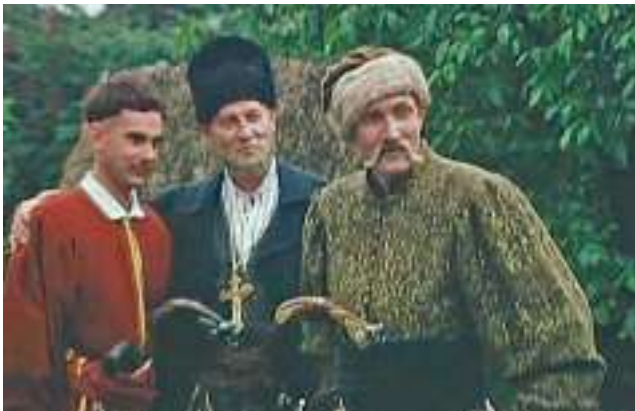
Кадр із кінофільму «Чорна рада»

Справді, Василь Невольник був собі дідусь такий мізерний, мов зараз тільки з неволі випущений: невеличкий, похилий, очі йому позападали й наче до чого придивляються, а губи якось покривилися, що ти б сказав — він і зроду не сміявся. У синьому жупанкові, у старих полотняних шароварах, да й те на йому було, мов позичене.