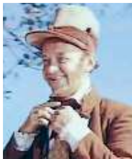
Кадр із кінофільму «Наталка Полтавка»

Возний Тетерваковський — сатиричний образ чиновника, хабарника, який страждає через те, що з кожним роком усе трудніше вибивати з людей гроші. Його інтереси — дріб'язкові й потворні: скарги, позови, пограбування. Це, за влучною характеристикою Миколи, «хапун такий, що із рідного батька злупить» . Возний знає, що люди бачать його зловживання, тож виправдовується тим, що всі обманюють. З цією метою він навіть переробив на свій лад пісню Г. Сковороди «Всякому гóроду нрав і права...» , у якій співає, що «хто не лукавить, той ззаду сидить» .