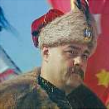
Кадр із кінофільму «Чорна рада»

— Колико-то гробів, а всі ж то тії люде жили на світі й усі пішли на суд перед Бога! Скоро й ми підем, де батьки й діди наші.