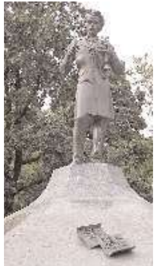
Пам'ятник Т. Г. Шевченку. м. Варшава (Польща)