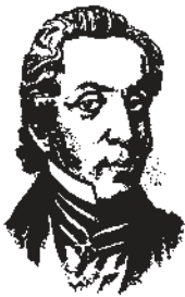
П. Гулак- Артемівський

Петро Петрович Гулак-Артемівський (справжнє прізвище Артемівський ) (1790–1865) народився в містечку Городищі Київської губернії (нині Черкаська обл.) у сім'ї священика. Навчався в Києво-Могилянській академії, викладав у приватному пансіоні в Бердичеві, працював домашнім учителем у сім'ях польських поміщиків. Свою долю пов'язав із Харківським університетом — справжнім центром освіти й науки. Після закінчення університету молодий науковець захистив магістерську дисертацію, викладав польську словесність, історію, географію, статистику, працював деканом словесного факультету, потім ректором.