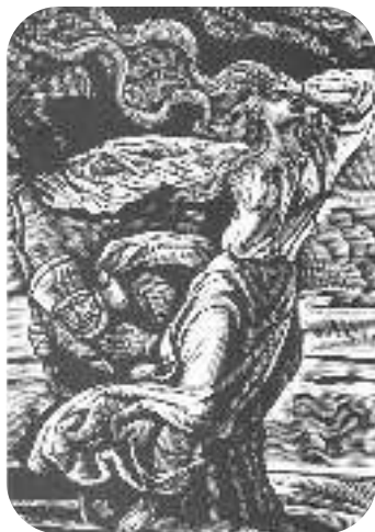
В. Лоната. Тополя