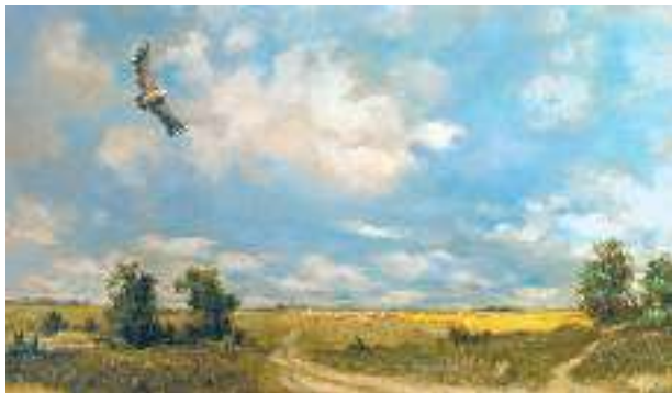
Ю. Пацан. «Чому я не сокіл, чому не літаю...»

Тема недолі, нарікання на життя, незадоволення земним буттям, бажання заховатися від сирітського горя — усім цим наповнений вірш. Тут переважають мотиви втечі від реалій, пошуку щастя. Ліричний герой, самотній сирота, скаржиться на долю, для якої він чужий, змалку нелюбий, наймит, хлопцюга приблудний . Риторичні фігури (« Чому мені, Боже, ти крилець не дав? », « Хіба ж хто кохає нерідних дітей? »), тавтології (« Чужий я у долі, чужий у людеї »), розлогі метафори підкреслюють приреченість на самотність.