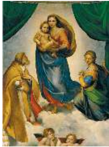
Рафаель. Сикстинська Мадонна