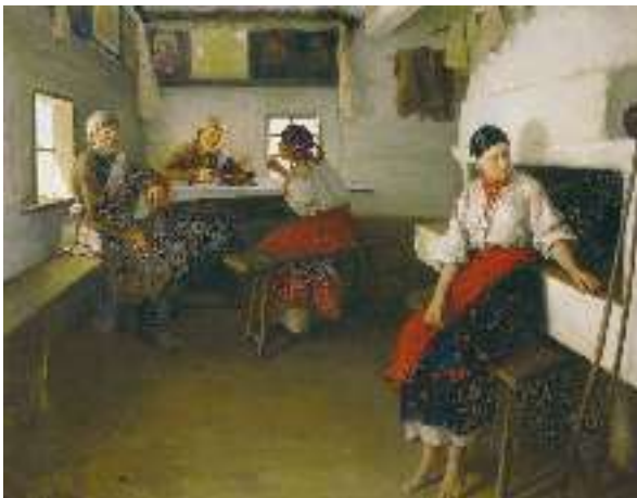
М. Пимоненко. Свати

— Чи чуєш, Марусю, що батько каже? Іди ж, іди та давай, чим людей пов'язати. Або, може, нічого не придбала та із сорому піч колупаєш? Не вміла матері слухати, не вчилася прясти, не заробила рушників, так в'яжи хоч валом, коли і той ще є.