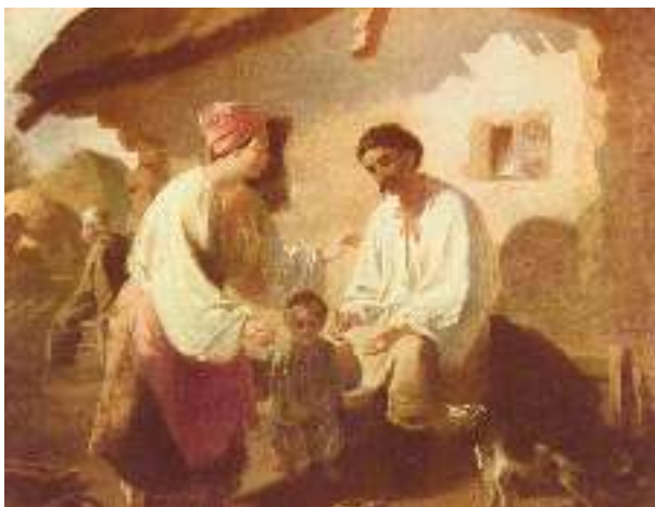
Т. Шевченко. Селянська родина

вірша в образі покритки автор зображує покріпачену, пригноблену Україну (пригадайте подібні жажливі картини в поемі «Сон» («У всякого своя доля...»): «То покритка попідтинню / З байстрам шкандибає, / Батько й мати одцурались / Й чужі не приймають!!» ):