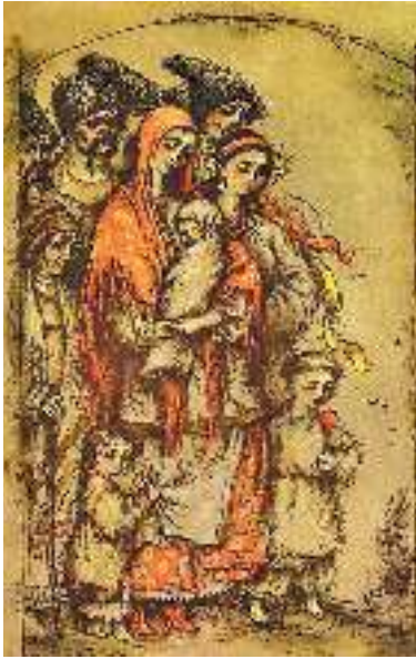
К. Штанко. Ілюстрація до поеми-послання Т. Шевченка «І мертвим, і живим, і ненарожденним...»

Отака-то наша слава, Слава України. Отак і ви прочитай[те], Щоб не сонним снились Всі неправди, щоб розкрились Високі могили Перед вашими очима, Щоб ви розпитали Мучеників, кого, коли, За що розпинали! Обніміте ж, брати мої, Найменшого брата — Нехай мати усміхнеться, Заплакана мати. Благословить дітей своїх Твердими руками І діточок поцілує Вольними устами. І забудеться срамотня Давня година, І оживе добра слава, Слава України, І світ ясний, невечерній Тихо засіяє... Обніміться ж, брати мої, Молю вас, благаю!