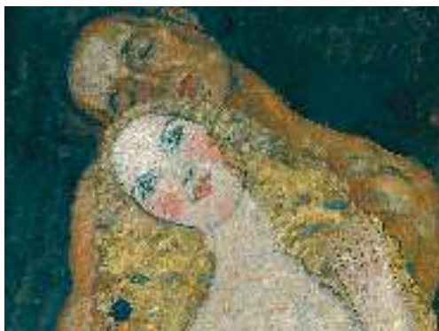
Г. Клімт. Адам та Єва

Легенди про створення світу, про перших людей Адама та Єву, про потоп на Землі й Вавилонську вежу — невеликі за обсягом, проте насичені образністю. Лише кількома штрихами створюється кольорова рельєфна картина світу: «Сказав Бог: “Нехай на землі виросте всіляка зелень: трава й дерева” ».