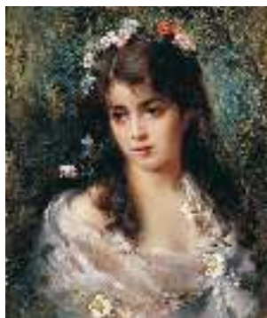
К. Маковський. Дівчина в костюмі Флори

Таку не часто скинеш оком, Такою тільки що марить... А раз зустрінеш ненароком — Навіки долю озарить!