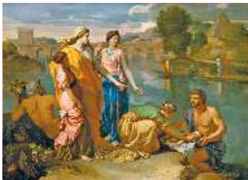
Н. Пуссен. Урятування Мойсея

плем'я не стало для Єгипту небезпечним, щоб під час війни не допомагало ворогам. Ізраїльтян почали примушувати до найтяжчих робіт на будівництві. Єгиптяни їх ненавиділи, але кількість нащадків Якова постійно зростала. Один із фараонів наказав убивати кожного новонародженого ізраїльського хлопчика.