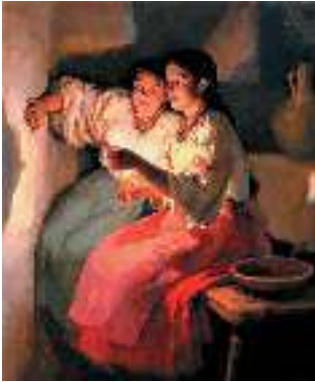
М. Пимоненко. Святочне ворожіння