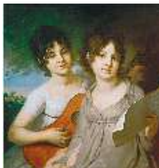
В. Боровиковський. Княжни Гагаріни