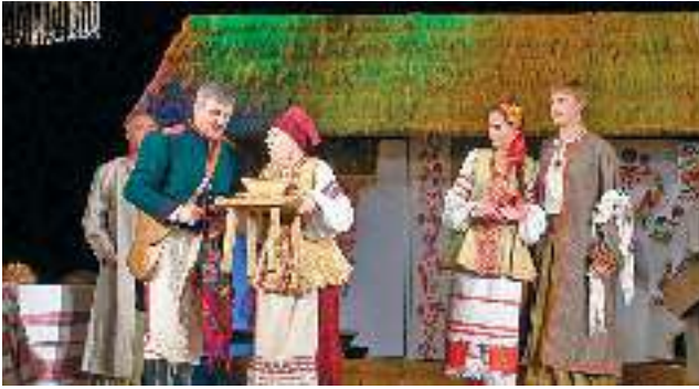
Сцена з вистави «Сватання на Гончарівці».

Львівський національний драматичний театр ім. М. Заньковецької