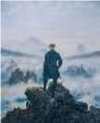
Д. Ф. Каспар. Мандрівник над морем туману