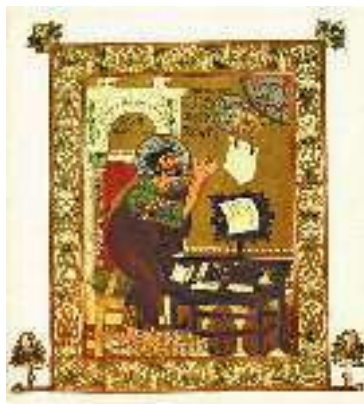
Остромирове Євангеліє. Мініатюра. 1015–1057 рр.

Другою датованою давньоруською писемною пам'яткою є Ізборник Святослава (1073). Це — архаїчна рукописна хрестоматія, що містить