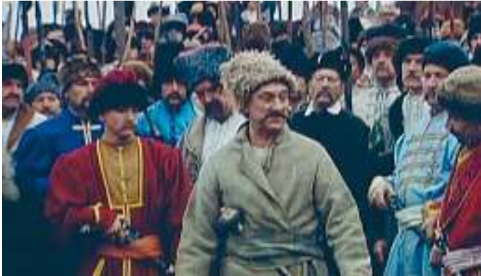
Кадр із кінофільму «Чорна рада»

жа. І постать, і врода в його була зовсім не гетьманська. Так наче собі чоловік простенький, тихенький. Ніхто, дивлячись на його, не подумав би, що в сій голові вертиться що-небудь, окрім думки про смачний шматок хліба да затишну хату. А як придивишся, то на виду в його щось наче ще й приязне: так би, здається, сів із ним да погугорив де про що добре да мирне. Тільки очі були якісь чудні — так і бігають то сюди, то туди і, здається, так усе й читають спідтишка чоловіка. Іде, трошки згорбившись, а голову схилив набік так, наче каже: «Я ні від кого нічого не бажаю, тільки мене не чіпайте». А як у його чого поспитаються, а він одвітує, то й плечі, наче той жид, підійме, і набік одступить, що б ти сказав — він усякому дає дорогу; а сам знітиться так, мов той цуцик, ускочивши в хату.