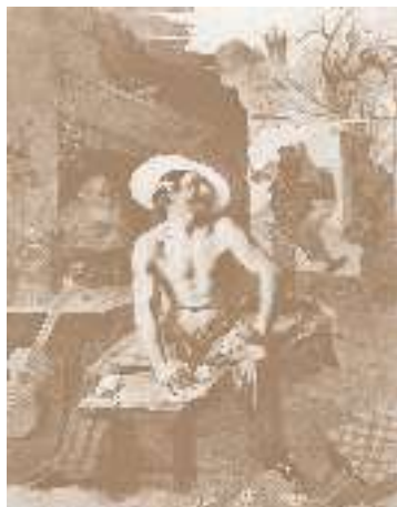
Т. Шевченко. Програвся в карти (із серії «Притча про блудного сина»)

роман «Собор Паризької Богоматері» В. Гюго тощо. Т. Шевченко, перебуваючи в засланні, створив живописну серію «Притча про блудного сина»; відома також на цю тему картина Рембрандта. До скарбниці світових шедеврів живопису належать «Сикстинська Мадонна» Рафаеля, «Вавилонська вежа» П. Брейгеля Старшого, «Страшний суд» Мікеланджело, «Таємна вечеря» Леонардо да Вінчі та ін.