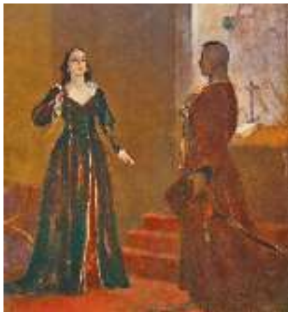
М. Деревус. Ілюстрація до повісті М. Гоголя «Тарас Бульба». (Фрагмент)