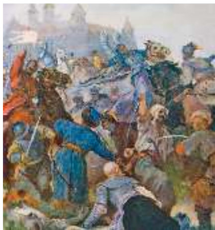
М. Деревус. Ілюстрація до повісті М. Гоголя «Тарас Бульба». (Фрагмент)

— Прощайте, пани-браття, прощайте, товариство! Хай же вічно стоїть православна земля козацька й хай буде вічна їй честь!