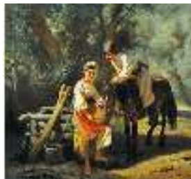
К. Трутовський. Сцена біля криниці