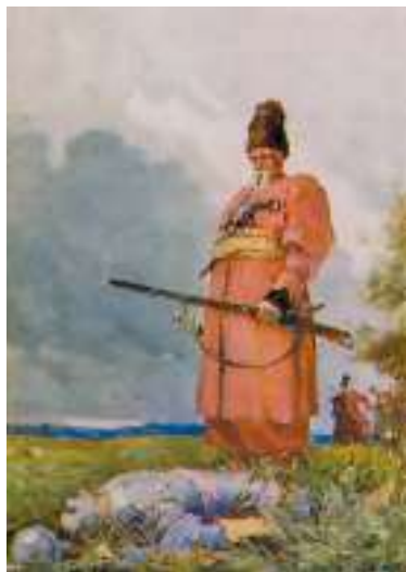
М. Дерезус. Ілюстрація до повісті М. Гоголя «Тарас Бульба»

Зупинився синовбивець і довго дивився на бездиханне тіло. Він і мертвим був прекрасний; мужнє лице його, ще недавно повне сили й непереможного для жіночого серця чару, і тепер виявляло чудову красу; чорні брови, як жалобний оксамит, відтінювали його зблідлі риси.