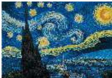
В. Ван-Гог. Зоряна ніч