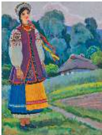
І. Гончар. Застрілася

Виборний. Золото — не дівка! Наградив Бог Терпилиху дочкою. Крім того, що красива, розумна, моторна і до всякого діла дотепна, — яке в неї добре серце, як вона поважає матір свою, шанує всіх старших себе; яка трудяща, яка рукодільниця; себе й матір свою на світі держить.