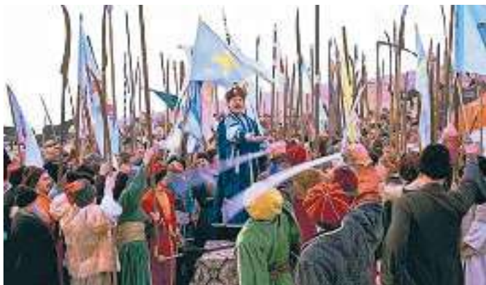
Кадр із кінофільму «Чорна рада»

Оглянеться Сомко, аж при йому тільки зо жменю старшини.