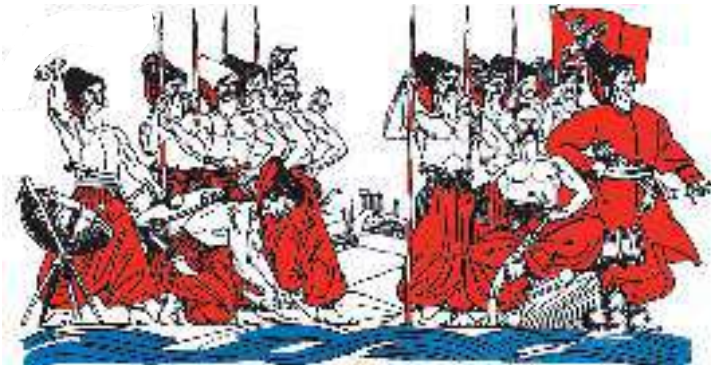
А. Базилевич. Ілюстрація до поеми І. Котляревського «Енеїда»

У главной башти на сторожі Стояли Евріал і Низ; Хоть молоді були, та гожі, І кріпкі, храбрі, як харциз. В них кров текла хоть не троянська, Якась чужая — бусурманська, Та в службі вірні козаки. Для бою їх спіткав прасунок, Пішли к Енею на вербунок; Були ж обидва земляки.