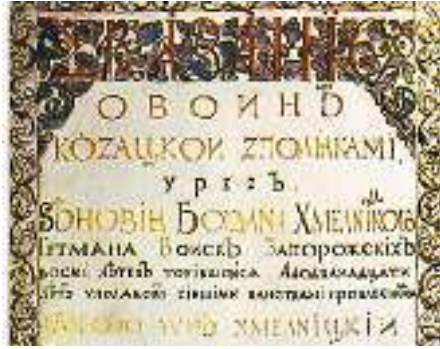
Титульна сторінка «Літопису Самійла Величка»

церковнослов'янськими. «Літопис Самовидця» став не лише основою для створених пізніше літописів С. Величка й Г. Граб'янки, а й важливим джерелом для вивчення історії України.