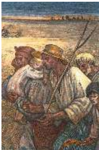
В. Касян. Ілюстрація до поеми-послання Т. Шевченка «І мертвим, і живим, і ненарожденним...»

І смеркає, і світає, День Божий минає, І знову люд потомлений, І все спочиває. Тільки я, мов окаянний, І день і ніч плачу На розпуттях велелюдних, І ніхто не бачить, І не бачить, і не знає — Оглухли, не чують; Кайданами міняються, Правдою торгують. І Гóспода зневажають, Людей запрягають В тяжкі ярма. Орють лихо, Лихом засівають, А що вродить? побачите, Які будуть жніва! Схаменіться, недолуди, Діти юродиві! Подивіться на рай тихий, На свою країну, Полюбіте щирим серцем Велику руїну, Розкуйтеся, братайтеся, У чужому краю Не шукайте, не питайте Того, що немає І на небі, а не тільки На чужому полі. В своїй хаті своя й правда, І сила, і воля.