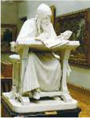
Нестор Літописець. Скульптура М. Антокольського

цивілізації. Далі мовиться про історію розселення слов'ян, зокрема східних, про їхні звичаї та мову. Літопис розповідає нам про початок створення Київської держави, про перших наших князів.