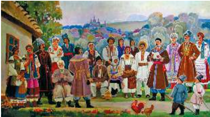
І. Гончар. Подоляни

Отак раз на клечальній неділі була Маруся у своєї подруги в дружках на весіллі й сиділа за столом. Проти дружечок, звичайно, сиділи бояри. Старшим боярином був з города парубок, свитник Василь. Хлопець гарний, русявий, чисто підголений; чуб чепурний, уси козацькі, очі веселенькі, як зірочки; на виду рум'яний, моторний, звичайний; жупан на ньому синій і китаєва юпка, поясом з аглицької каламайки підперезаний, у тяжинових штанях, чоботи добрі, шкапові, з підковами. Як пришивали боярам до шапок квітки, то всі клали по шагу, хто-хто два, та й лакей з панського двора — і той п'ять шагів положив, що всі здивувались, а Василь усе вижидав та усе в кишені