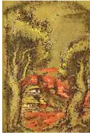
К. Штанко. Ілюстрація до поеми Т. Шевченка «Сон» («У всякого своя доля...»)

Автор поеми піддає різкому висміюванню свого земляка, якого зустрів перед царським палацом. Цей дрібний чиновник-хабарник