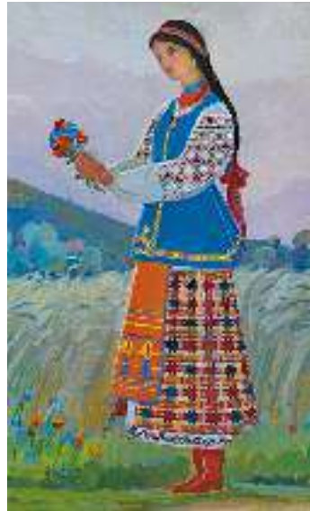
І. Гончар. Дівчина

Горе, що спіткає цих ідеальних героїв, здатне розчулити будь-яке серце. Саме таке завдання ставили перед собою сентименталісти. За стильовими ознаками — це сентиментально-реалістична повість .