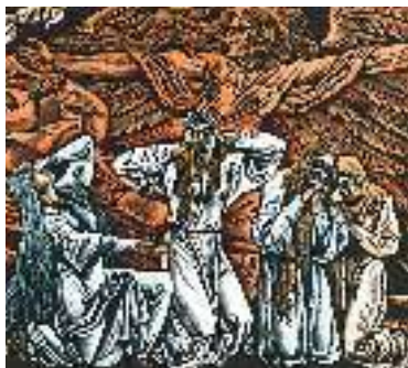
В. Лопата. Ілюстрація до «Слова про похід Ігорів». (Фрагмент)

Образ Ярославни , дружини Ігоря, сповнений тонкого ліризму. Вона тужить не тільки через полон Ігоря, а й через загибель усіх руських воїнів.