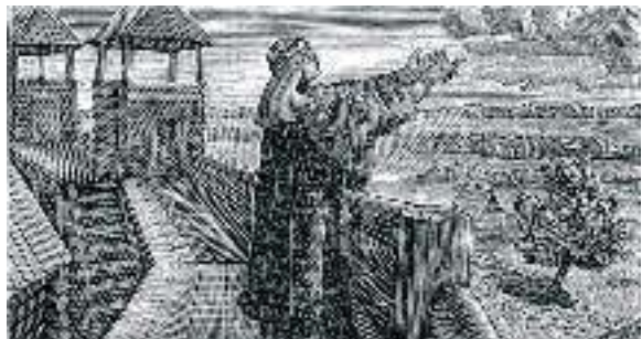
В. Назарук. Слово про похід Ігорів; М. Пимоненко. Суперники; Т. Шевченко. Катерина; В. Фаворський. Ярославна