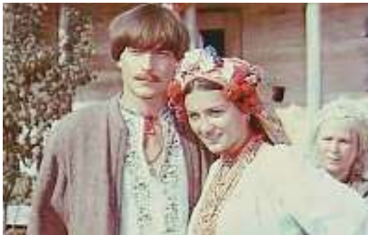
Кадр із кінофільму «Наталка Полтавка»

Петро і Наталка (обнімають матір) . Мати наша рідная, благослови нас!