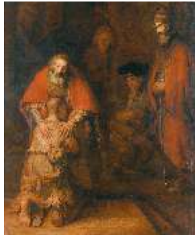
Рембрандт. Повернення блудного сина