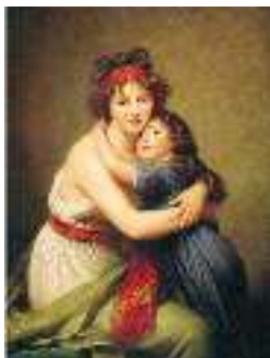
Е. Віже-Лебрєн. Автопортрет з дочкою