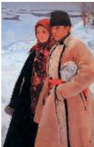
О. Мурашко. Зима

І. Котляревський, творчість якого ви будете вивчати найближчим часом, переробивши пісню «Сонце низенько», використав її в п'єсі «Наталка Полтавка». Саме цей варіант пісні й став улюбленим для багатьох поколінь українців.