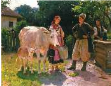
М. Пимоненко. Суперниці. Біля колодязя