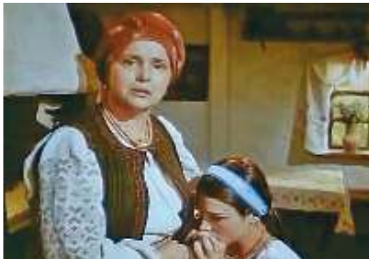
Кадр із кінофільму «Наталка Полтавка»

Наталка й мати розмірковують про своє безталанне життя. Терпилиха каже дочці, що як батько не дав Наталці перед смертю благословення на одруження з Петром, так і вона не дасть. Наталка кидається до матері й просить не губити її.