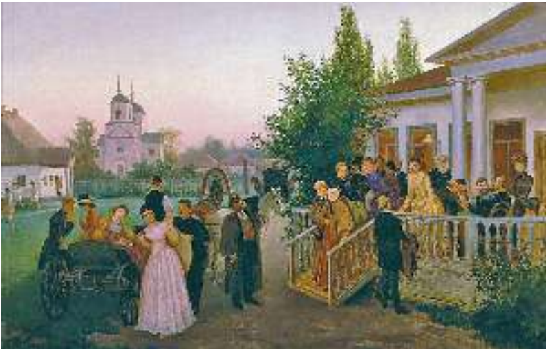
К. Трутовський. Від'їзд гостей

Він спокійненько собі й каже, ласкаво їй усміхаючись: