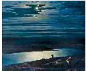
А. Куїнджі. Місячна ніч на Дніпрі. (Фрагмент)