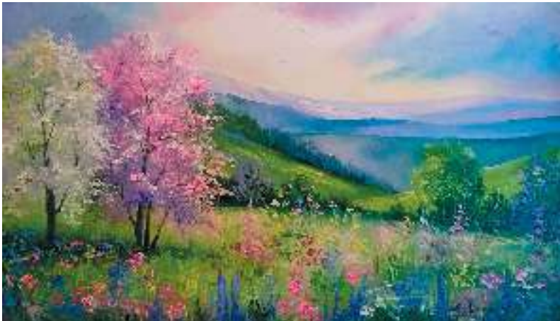
О. Дарчук. Весна в Карпатах

Урочистість та оптимізм біблійного переспіву (без сумніву, і музикальність) надихнули М. Лисенка написати кантату 1 «Радуйся, ниво неполитая!».