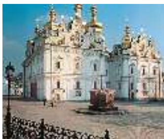
Зображення Успенського собору в XVII ст., під час Другої світової війни й сучасний вигляд