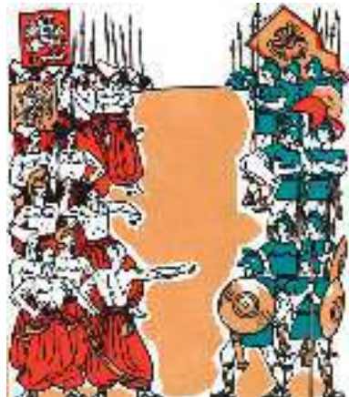
А. Базилевич. Ілюстрація до поеми І. Котляревського «Енеїда»

Класицизм (з латин. classicus – зразковий) – художній стиль і напрям в європейській літературі XVII–XVIII ст., для якого характерні увага до античних зразків, до духовної та матеріальної культури, суворе дотримання єдності жанрів, засобів художньої виразності, оспівування «сильних світу цього». В Україні не було передумов для розвитку «високих» жанрів античної літератури – трагедії,