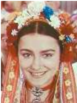
Кадр із кінофільму «Наталка Полтавка»

Тема, ідея, жанр твору. Основний мотив п'єси — розлука дівчини з коханим-бідняком та одруження з осоружним багатієм. Тематика твору доволі широка: зображення побутових суперечностей українського села, соціальної нерівності; показ життя селян, бурлаків, чиновників; відтворення традицій, звичаїв і пісень. Основна ідея : оспівування духовної величі людини з народу. І. Котляревський один із перших в українській літературі взяв головну героїню з народу — просту дівчину — і показав її високі духовні якості (у цьому полягає новаторство автора). За жанром «Наталка Полтавка» — соціально-побутова драма , глибоконаціональна характеристиками й естетичною формою, перший твір нової української драматургії. І. Котляревський так визначив жанр твору: « Опера малоросійська у двох діях », що передбачає багато музики й пісень. Усього в тексті 20 пісень — арії, дуети, тріо, хор — як фольклорного походження (« Віють вітри, віють буйні... », « У сосіда хата біла »), так і літературного (« Всякому городу нрав і права... », « Сонце низенько »).