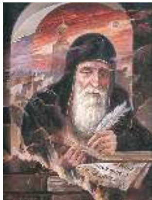
В. Слєпченко. Нестор Літописець

Нам, читачам ХХІ ст., цікаво дізнатися, про що йдеться в одному з найдавніших оригінальних творів українського народу. Як уже зазначалося, розповідь у творі ведеться з найдавніших часів, від Ноя. Упорядник вважає, що саме від його нащадків, Сима, Хама та Яфета, утворилися народи. «Слов'янське плем'я єдине, і мова в нього одна, — пише літописець, — а назва “Русь” походить від варягів». Отже, якщо наші предки походять від Яфета, то це означає, що вони — нащадки нашої