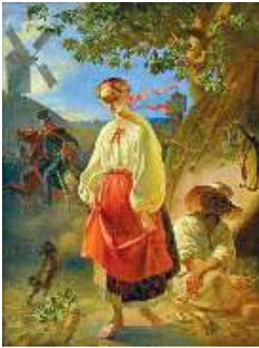
Т. Шевченко. Катерина