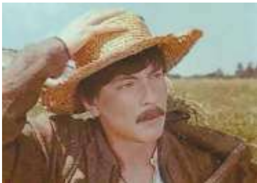
Кадр із кінофільму «Наталка Полтавка»