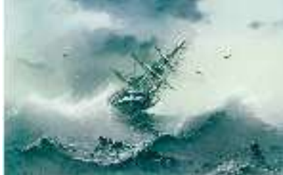
І. Айвазовський. Шторм