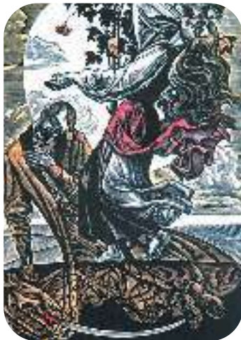
В. Лоната. Калина