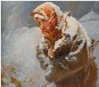
Ф. Коновалюк. Ілюстрація до поєми Т. Шевченка «Катерина»

Поєма розповідає про трагічну долю покритки й дитини-безбатченка в умовах кріпосного суспільства, у якому норми народної моралі були надто жорстокі. Відомо, як у той час ставилися до матерів, які народжували позашлюбних дітей: їх цуралися навіть батьки. Однак не Т. Шевченко: він не тільки не цурається зганьблених жінок, а й стає на їхній захист.