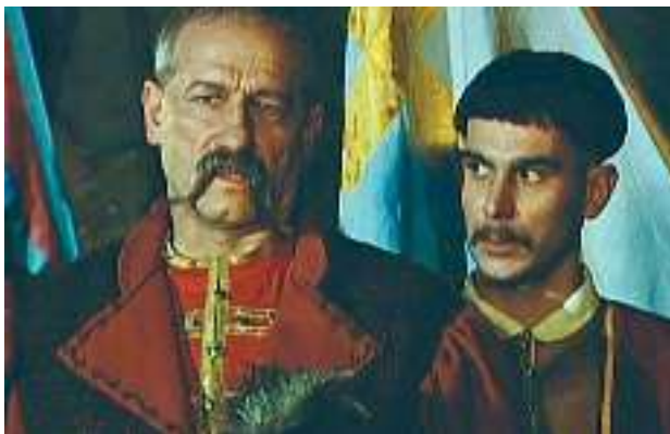
Кадр із кінофільму «Чорна рада»

то й забули реєстрове його прізвище. І в реєстрах-то, коли хочете знати, не Чепурним його записано.