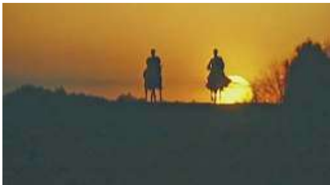
Кадр із кінофільму «Чорна рада»

лося. А подорожні були якось сумні. Ніхто б не сказав, що вони ідуть у гості до веселого пана Череваня.