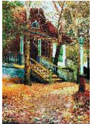
П. Левченко. Осінь у саду

— Злодійка! Злодійка! — картає пані бабусю, вкогтившись їй у плече, і соває стару, і штовхає.