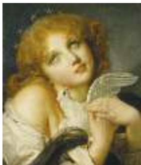
Ж. Б. Грьоз. Спогади