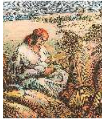
В. Касіян. Ілюстрація до вірша Т. Шевченка «Сон» («На панщині пшеницю жала...»)

Над сином сидя, задрімала. І сниться їй той син Іван І уродливий, і багатий, Не самотній, а самотній На вольній, багачиться, бо й сам Уже не панський, а на волі; Та на своїм веселім полі Свою таки пшеницю жнуть, А діточки обід несуть. І усміхнулася небога, Проснулася — нема нічого... На сина глянула, взяла, Його тихенько сповила Та, щоб дожати до ланового, Ще копу дожинати пішла.