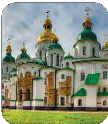
Софія Київська. м. Київ