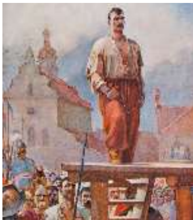
М. Дерезус. Ілюстрація до повісті М. Гоголя «Тарас Бульба». (Фрагмент)

Але як узяли його на останні смертельні муки, здалося, немовби почала підупадати його сила й повів він навколо себе очима. «Боже, усе невідомі, усе чужі люди! Хоч би хто-небудь із рідних, близьких його серцеві був тут, при його смерті!»