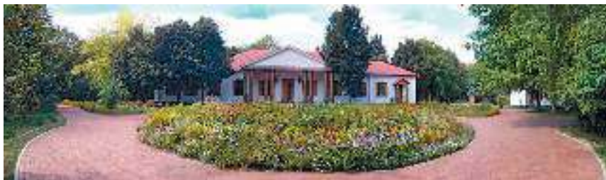
Національний музей-заповідник М. В. Гоголя. с. Гоголеве, Полтавська область. Сучасне фото

братимства. Розраду від нездійснених планів письменник знаходив у творчості.